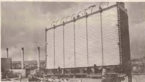
Unidad di Aquanova ta wordu transporta pa W.L.B. como parti di proyecto di modernisacion.

Awa ta e ingrediente indispensable pa bida. Mirando cu e planta di W.E.B. ta birando anticua, Gobierno di Aruba